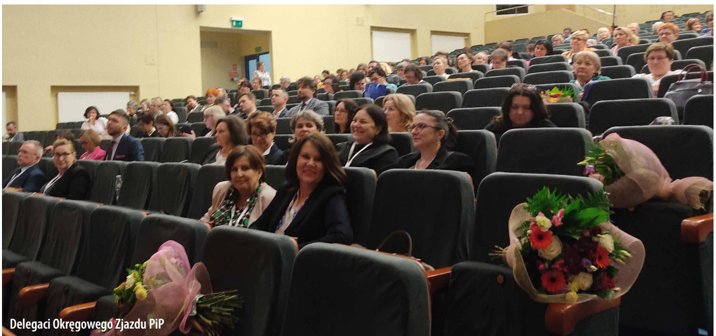
Delegaci Okręgowego Zjazdu PiP