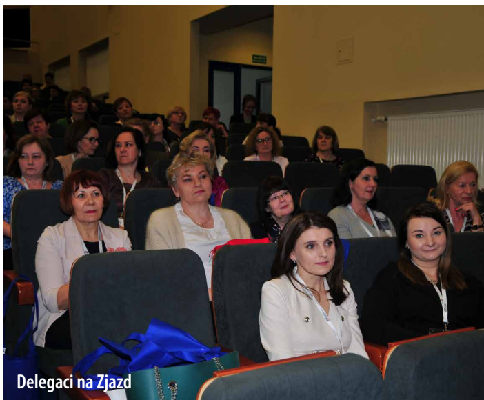
Delegaci na Zjazd