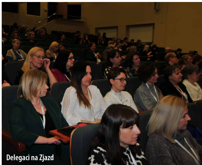
Delegaci na Zjazd